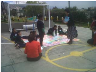
Descubriendo nuevas destrezas.