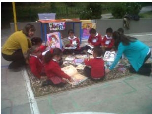
Docentes, padres, madres de familia y estudiantes, como una gran familia.